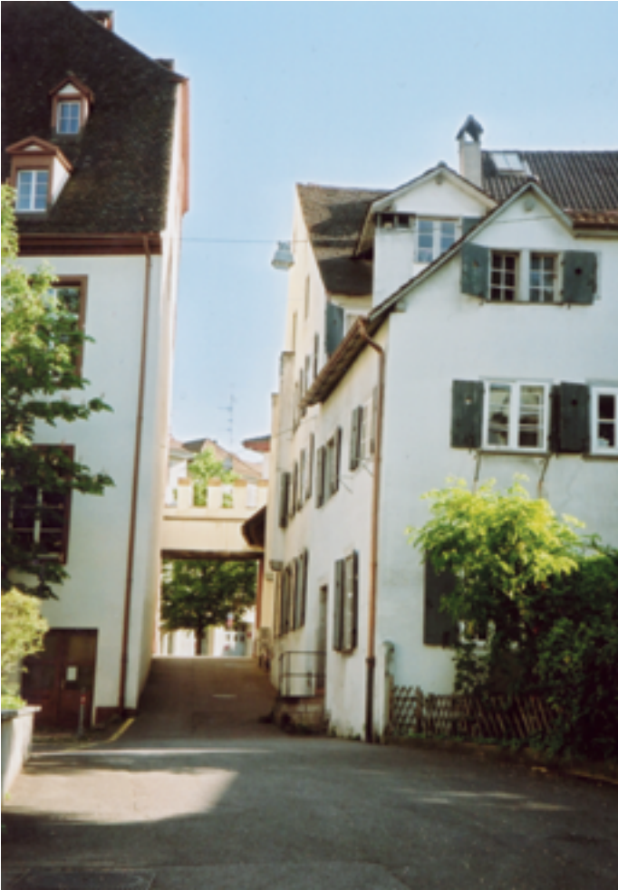
Der 'Karrenhof' vom Vesalgässlein aus

Dem von der Denkmalpflege zu einem unbekanntem Zeitpunkt verfassten detaillierten Baubeschrieb der Liegenschaft Spalenvorstadt 16 ist Folgendes zu entnehmen: