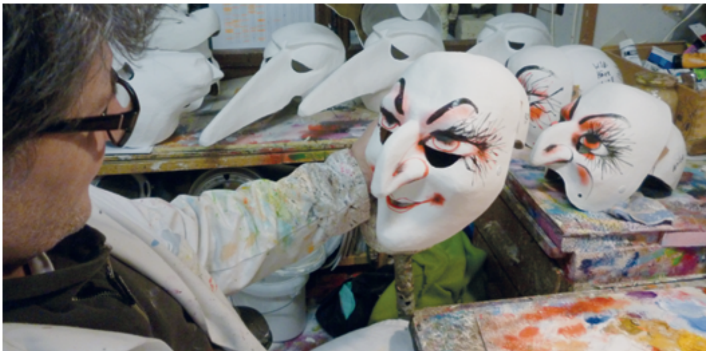
Im Larvenatelier 'Charivari' entstehen die 'Wildi Häxe'-Larven für die Fasnacht 2014

In ihrer 14. Ausgabe (Dezember 2010) hat die SpaleZytig über jene renommierte Fasnachtsgesellschaft berichtet, die am Cortège unser Quartier eindrücklich vertritt: die Spale Clique. Es war dort zu erfahren, dass ihre Gründung ins Jahr 1926 zurückreicht, dass man 4 Jahre später die Verbundenheit mit dem Spalenquartier dokumentieren wollte und den Namen 'Valencia-Clique' in 'Spale Clique' änderte, dass 1948 eine Junge Garde und 1996 die Alte Garde gegründet wurde und dass seit 1987 das weibliche Geschlecht willkommen ist. Die Spalemer sind stolz auf 'ihre' Clique, die rund 130 Jugendlichen, die etwa 120 Mitglieder des Stamms und die knapp 50 Mitglieder der Alten Garde, welche die Tradition des Cliquenwesens wachhalten.