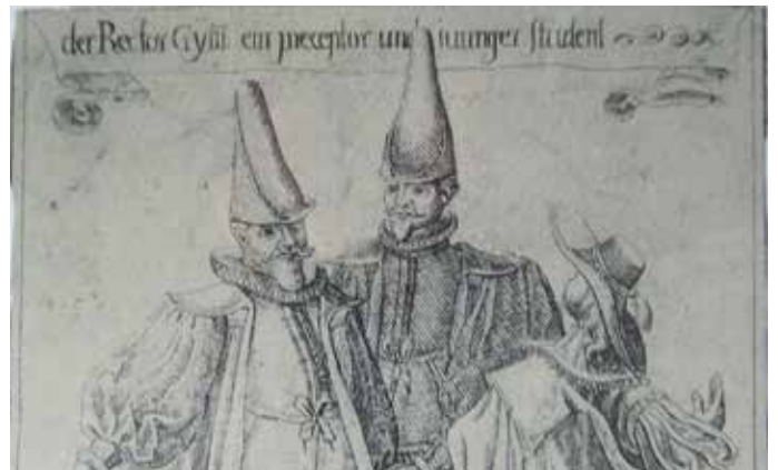
Der Rektor des Gymnasiums, ein Lehrer und ein junger Student

Darauf folgt mit 25 Blättern die Bevölkerung selbst, mit entsprechender Berücksichtigung des weiblichen Elements. Grüppchenweise treten Bürger und Adlige auf. In einer weiteren Gruppe von zwölf Blättern werden die unterschiedlichsten Berufe und Leute vorgestellt. Was die Kostüme, die Tracht selbst betrifft, erscheinen sie in dieser zweiten Folge gekonnter wiedergegeben. Gegenüber der Mode, zehn Jahre vorher, ist ein gewisser Wandel eingetreten: bei den Männern sind anstelle des Baselhutes mehr breitkrämpige Schlapphüte zu beobachten. Bei den Frauen haben die grossen runden Kappen zugenommen.