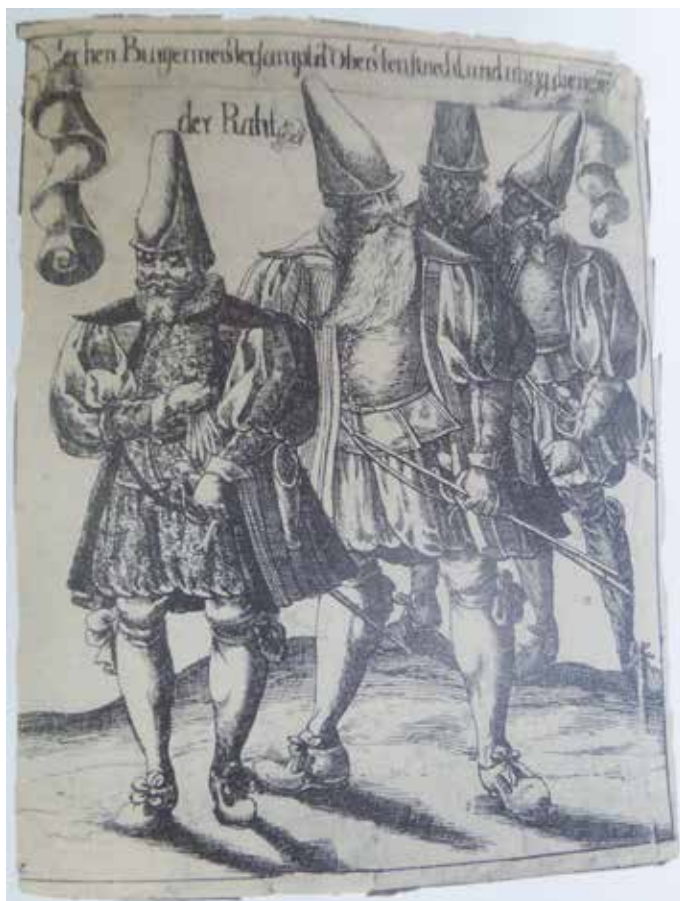
Der Herr Bürgermeister samt dem Oberstknecht und den übrigen Dienern