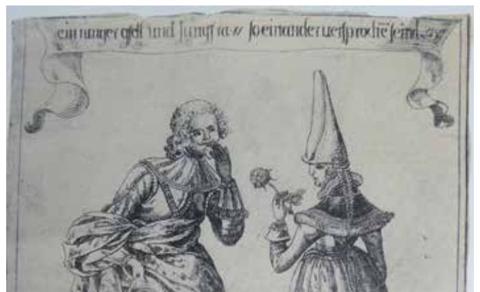
Ein Junggeselle und eine Jungfrau, die miteinander verlobt sind